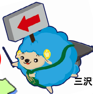
三沢市移住マスコット みさわしつじ