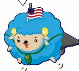
三沢市移住マスコット みさわしつじ